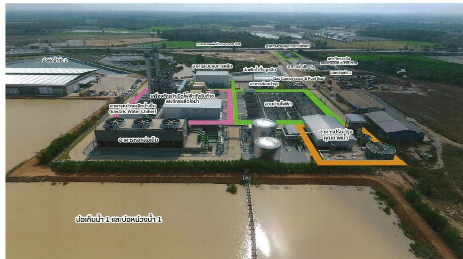
รูปที่ 1.2.1-3 พื้นที่ส่วนผลิตของโครงการโรงไฟฟ้าพลังงานสะอาดเกาะขนุน (ส่วนขยาย ครั้งที่ 1)